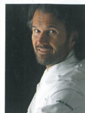
CARLO CRACCO AL CRACCO A PALAZZO, MILANO