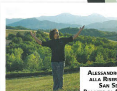
ALESSANDRO BORGHESE ALLA RISERVA PRIVATA SAN SETTIMIO, PALAZZO DI ARCEVIA (AN)

Il vostro mito è uno chef? Seguitelo e festeggiate il sì nel suo ristorante: un regalo per voi e per gli ospiti!