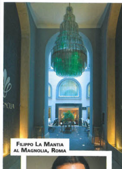
FILIPPO LA MANTIA AL MAGNOLIA, ROMA